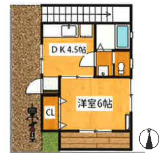
Maison Yoshida 102

ゆったり1DK 大きな収納 閑静な住宅街 落ち着いた暮らしを愛する方に最適♪ 激・おすすめ♪ お問い合わせは 株式会社大栄商事 電話 03-3671-3333