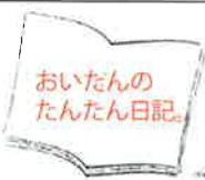
ご感想は編集部まで

年も明けてしばらく経ちましたが、明けましておめでとうございます。2015年も「たんたん日記」をご愛読していただけたらと思います。